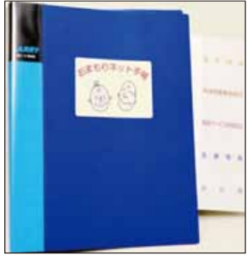
おまもりネット手帳 見本