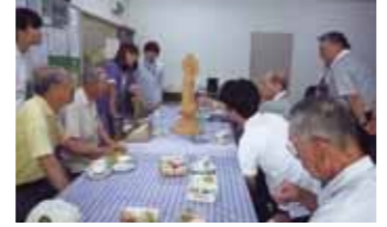
男性限定的日を設けて参加しやすく(宝栄)