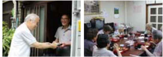
ボランティアが自宅へ訪問して利用者へ手渡す配食活動 / みんなで食事をして楽しくおしゃべりする会場活動

東成区内10校下の社会福祉協議会で高齢者食事サービス事業が実施されています。一人暮らしの高齢者や高齢者のみの世帯の方を対象とし、住み慣れた地域で孤立することなく、地域住民と交流をもちながら地域での生活を健康的に継続していけるように取り組まれています。この活動は、利用者からの利用料と、委託料をもとに実施されています。