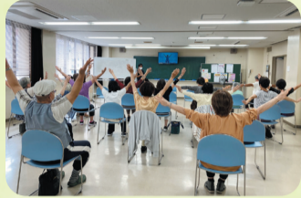
毎週行っている体操も改めて先生から教わってまた頑張ろう