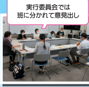
実行委員会では 班に分かれて意見出し