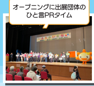
オープニングに出展団体の ひと言PRタイム