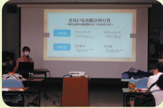
いくつになってもお肌はきれいに保ちたいですね