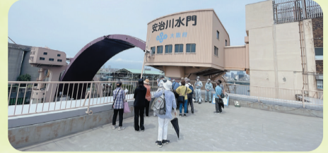
巨大な水門が稼働する様子は圧巻でした!