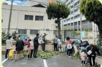
小さなお子様とお母さんとも土に触れて楽しそう