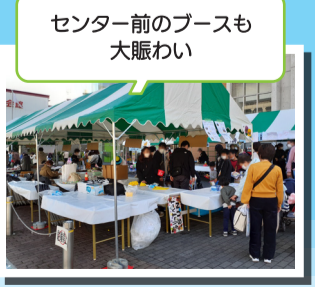
センター前のブースも 大賑わい