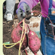
お土産のさつまいもが掘れたよ!