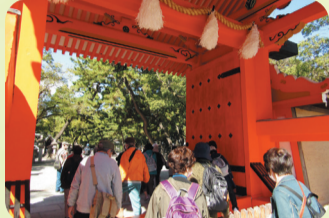
静かな境内を散策。白鹿の酒ミュージアムはお酒が飲めない私も楽しめました!