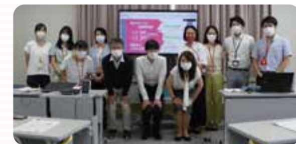
会場参加の皆様とスタッフ