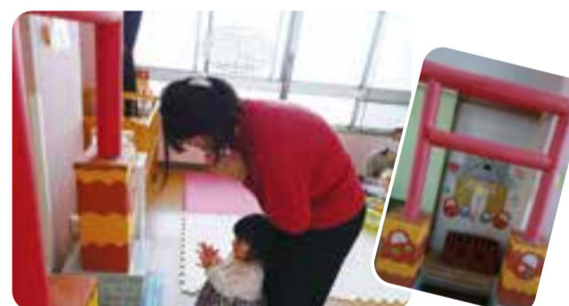
スラックで初詣! 今年はたくさん遊ばすように☆