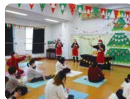
大きなクリスマスツリー みんなで作りました。