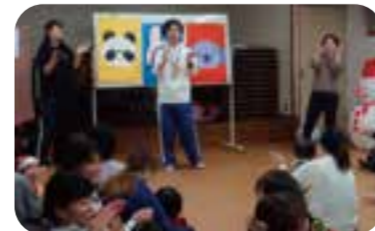
地域子育てサークルへの出張イベント

●休館日 月曜日・国民の祝日・年末年始(12/29~1/3) ※ただし7月21日~8月31日の間の月曜日と子どもの日5/5、海の日7/19、山の日8/11は開館しています。遊びに来てください。