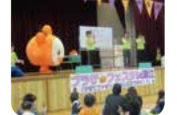
フェスタ in 深江

平素は当プラザの新型コロナウイルス感染症の感染予防対策にご協力を賜り心より感謝申し上げます。 子育て世代の皆様にとって本当に辛い日々が続いています。また、親子共々我慢する日常が続いています。このような状況の中でも、プラザを利用して、私たちに笑顔を見せてくださる保護者の皆様、そして無邪気に元気いっぱい遊ぶ子どもたちと出会うことで、私たちは『明るい未来』を信じる事が出来ます。本当にありがとうございます。 コロナが収束した時に訪れる「笑顔いっぱい社会」を楽しみにして、みんなで力を合わせてコロナを乗り越えましょう!