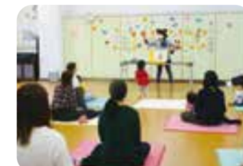
感染症予防に気を付けながら安心して遊べるようにしています。