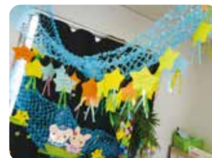
星形の短冊に願い事を書いて飾りました。

楽しみにしていたイベントが中止になる中で少しでも子どもたちに楽しんで欲しいといったスタッフの想いから「ちょこっと〇〇」シリーズを開催しました。参加してくれた子どもたちもそれぞれのイベントで可愛い笑顔をたくさんみせてくれました。