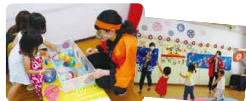
ヨーヨー釣り頑張りました。(実はお水入ってないんですよ)