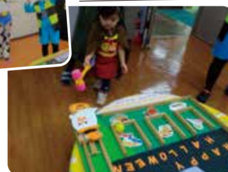
ハロウィンゲームで遊んだよ!