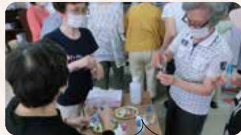
アロマでマスクスプレーを作ろう! 講座