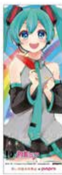
Illustration by 月島りさ © Crypton Future Media, INC. www.piapro.net piapro Illustration by 冬月がと © Crypton Future Media, INC. www.piapro.net piapro

初音ミクを通じて、クリエイターのみなさんとともに赤い羽根共同募金を盛り上げます。 今年は、ふれあい広場 2F大ホールにて、共同募金の受付を開設します。