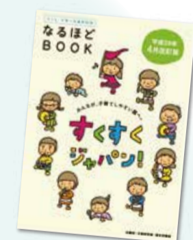
※詳細は、平成28年4月改訂版「なるほどBOOK」

「子ども・子育て支援新制度」とは、平成24年8月に成立した「子ども・子育て支援法」、「認定こども園法の一部改正」、「子ども・子育て支援法及び認定こども園法の一部改正法の施行に伴う関係法律の整備等に関する法律」の子ども・子育て関連3法に基づく制度のことをいいます。 【平成27年4月スタート】