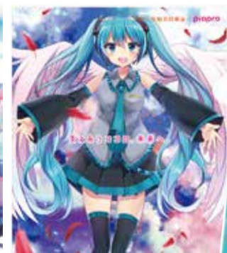
Illustration by 冬月がと © Crypton Future Media, INC. www.piapro.net piapro