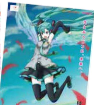
Illustration by 冬月がと © Crypton Future Media, INC. www.piapro.net piapro

問合せ 東成地区募金会 電話 6977-7031 (東成区在宅サービスセンター内)