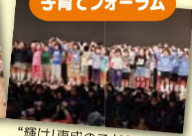
“輝け！東成のこどもたち”