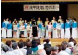
北中道敬老の集い