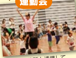
区役所と連携して