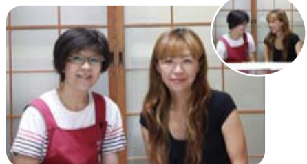
東中本校下 野坂サポーター

参加者、活動者がともに楽しく過ごすこと のできる環境づくりと誰もが気軽に声をかけあ える地域づくりは、みんなにとって居心地の良 い優しいまちをつくることにつながります。おま もりネット事業の周知にも力を入れて、支援が必 要な方の把握にも務めていきたいです。