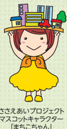
ささえあいプロジェクト マスコットキャラクター 「まちこちゃん」