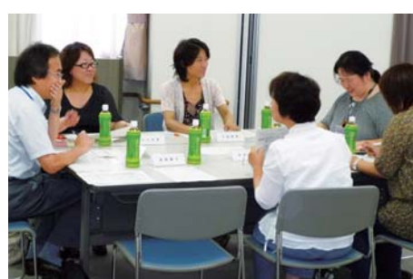
2010年6月25日 ステップアップ会議の様子

プランの策定に関わった区民の皆さんの参加により、プランの推進状況を確認し、自己評価を行い、今後の推進課題を明らかにする意見交換を行いました。