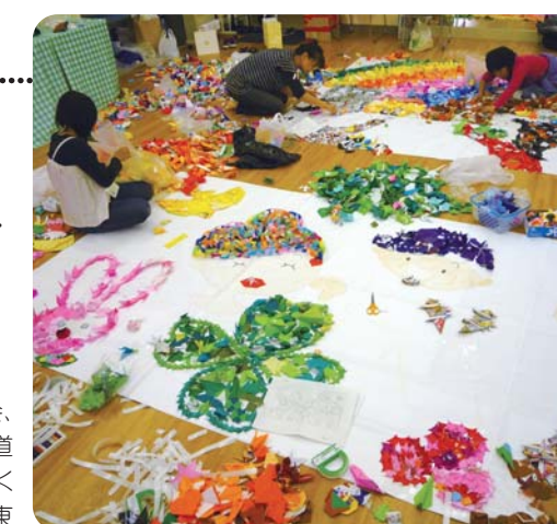
実行委員で折り紙アートの製作中