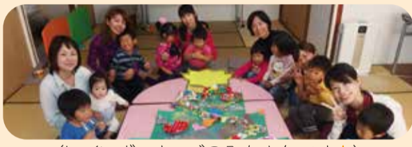
(レインボーキッズのみなさんです★)

よく利用させていただいてます。充実したイ ベントもたくさんあり、親子で大満足です。 【たんぼ組さんと遊ぼう!参加親子】