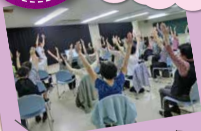
東成区老人福祉センター