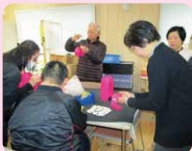
「活動の見学」の様子