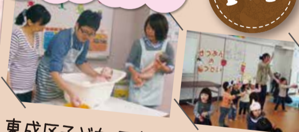
東成区子ども・子育てプラザ