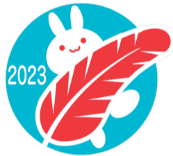
令和5年度記念パッチデザイン 「善意を運ぶ赤い羽根の舟」

東成区内では昨年、みなさまより6,541,440円のご厚意をお寄せいただきました。おひとりおひとりの善意が私たちの街を良くし、被災地の支援にも役立っています。東成区では、ボランティアの方々や地域で、また、学校や企業でも募金に協力していただいています。今年も募金へのご理解ご協力をお願いします。