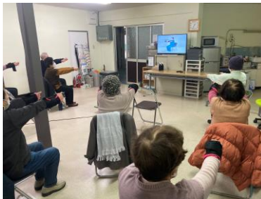
百歳体操 毎週月火曜・木曜

疎開道路を渡って通う方も、誰かが心配に思って誘いあっているような、そんな自然な支え合いがあります。一人で参加される方はいないんです。お互いが支え合えるから百歳体操は長く続いているのだと思います。