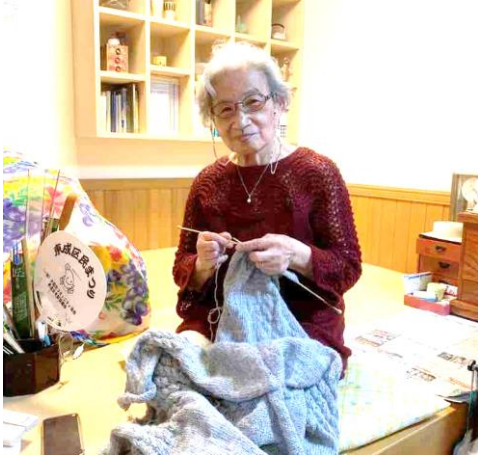
畳が落ち着く「私の場所」で

『工夫を当たり前 助け合いを自然に』をコンセプトに、個人の生活や、地域での助け合い活動の工夫を紹介します