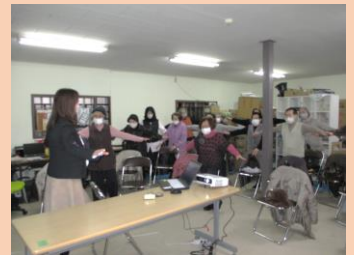
いきいきの集い 第4水曜