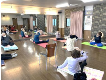
元気体操 第1・3月曜

先生からの楽しく優しいアドバイスを受けながら、タオルやボール、布の紐を使った体操とストレッチをおこない、転びにくい身体づくりと筋力アップをめざしています。