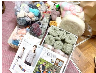
雑誌から今の流行もチェック

きっかけに、特大のポリ袋3杯分 の毛糸が自宅にやってきました。 コロナのおかげで時間がたっぷり 早速、帽子・セーター等をつくり 始めました。