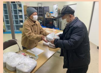
配食サービス活動 第2・4土曜