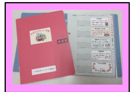
おまもりネット手帳 見本