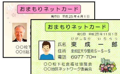
おまもりネットカード見本(表)

「おまもりネット事業」を活用することで、まわりの方に普通のくらしぶりを伝えることができます。それにより、地域福祉活動と福祉サービスをつなぎ、地域で安心してくらし続けることができます。