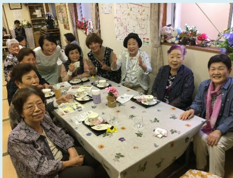
いつも集まる仲間とボランティアで記念撮影

つながりづくりや、閉じこもり予防を目的に開催されています。毎回20名くらいが参加され、にぎわっています。