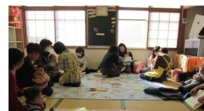
東成区子ども・子育てプラザでの「ブックスタート」開催時の様子

大阪市ではブックスタート事業を実施しています。「ブックスタート」とは、赤ちゃん(絵)本のはじめの出会いを応援しようという取り組みです。図書館ボランティア等による絵本の読み聞かせの楽しい体験と、家庭でも絵本を楽しむことが出来るよう、赤ちゃん(絵)本と保護者に絵本をプレゼントしています。東成区では子育て相談や親子の交流の場を提供している東成子育て支援センターと子ども・子育てプラザで毎月開催しています。区役所で実施している3ヶ月健診の際に引換券をお渡ししていますので、実施施設にご予約して参加してください。