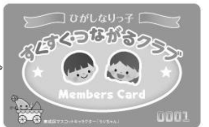
（メンバーズカード）