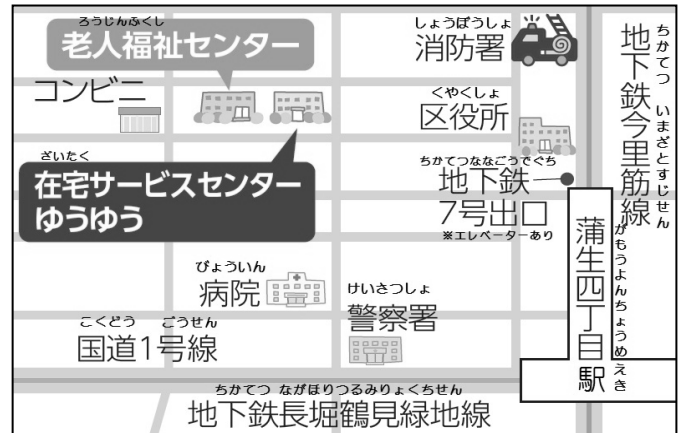
城東区社会福祉協議会 付近図